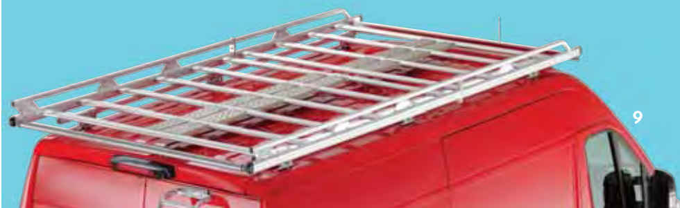
9 - Alumínium tetőcsomagtartó 10 - Alumínium keresztirányú tetőcsomagtartó rudak

A kifejezetten a márka haszongépjárműveihez tervezett tetőcsomagtartókkal a CITROËN új értelmet ad a „funktionalitás” fogalmának. A nehéz és/vagy terjedelmes rakományok szállításához kifejlesztett tetőcsomagtartók egyszerre stílusosak és biztonságosak. Nem is hiszi, mekkora terhet vesznek le a válláról.